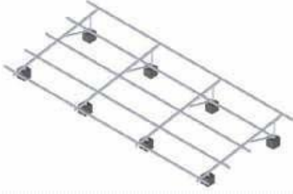
4. 横ラックの取り付け