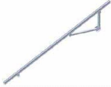
2. 縦フレームの組み立て